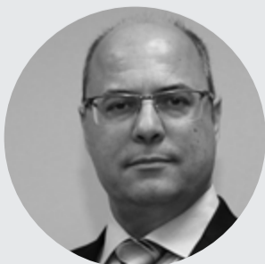
Wilson Witzel é Governador do Estado do Rio de Janeiro.