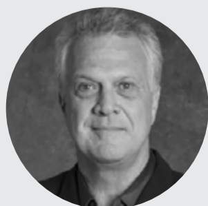
Pedro Bial é Jornalista e Escritor.

Isso sim, é causa, é notícia: não sucumbir ao cinismo.