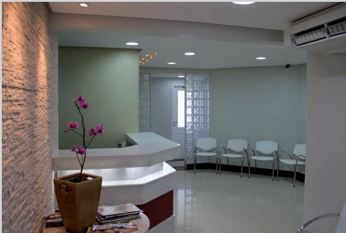
Instalações da CAA/DF