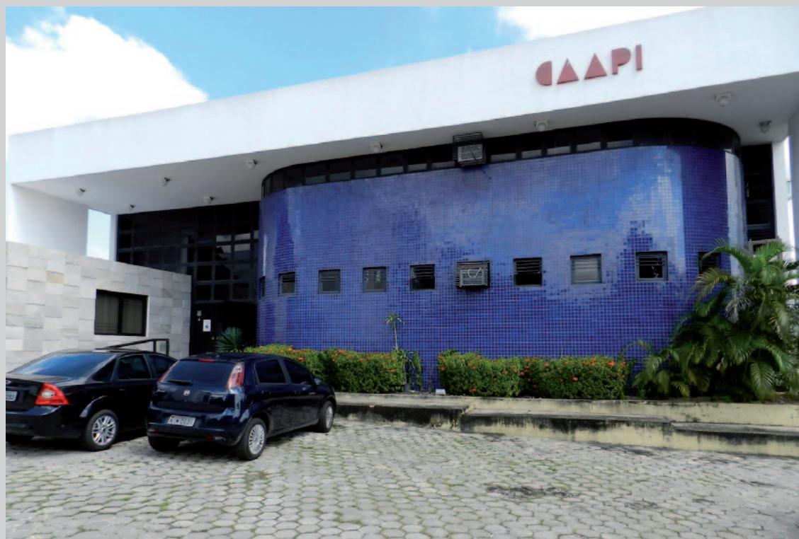
Sede da CAA/PI