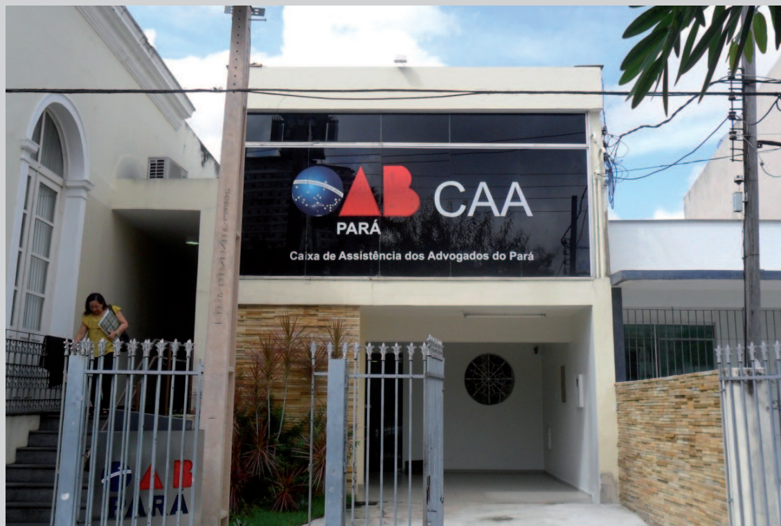
Sede da CAA/PA