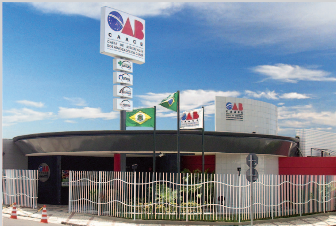
Sede da CAA/CE