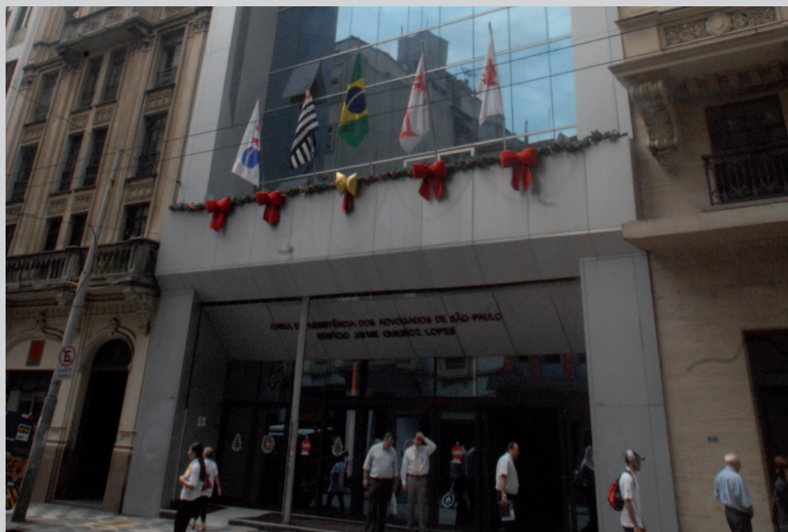
Sede da CAA/SP