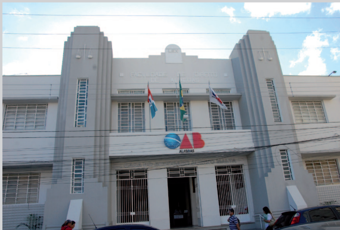
Sede da CAA/AL