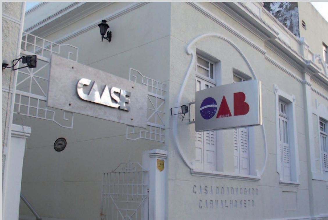
Sede da CAA/SE