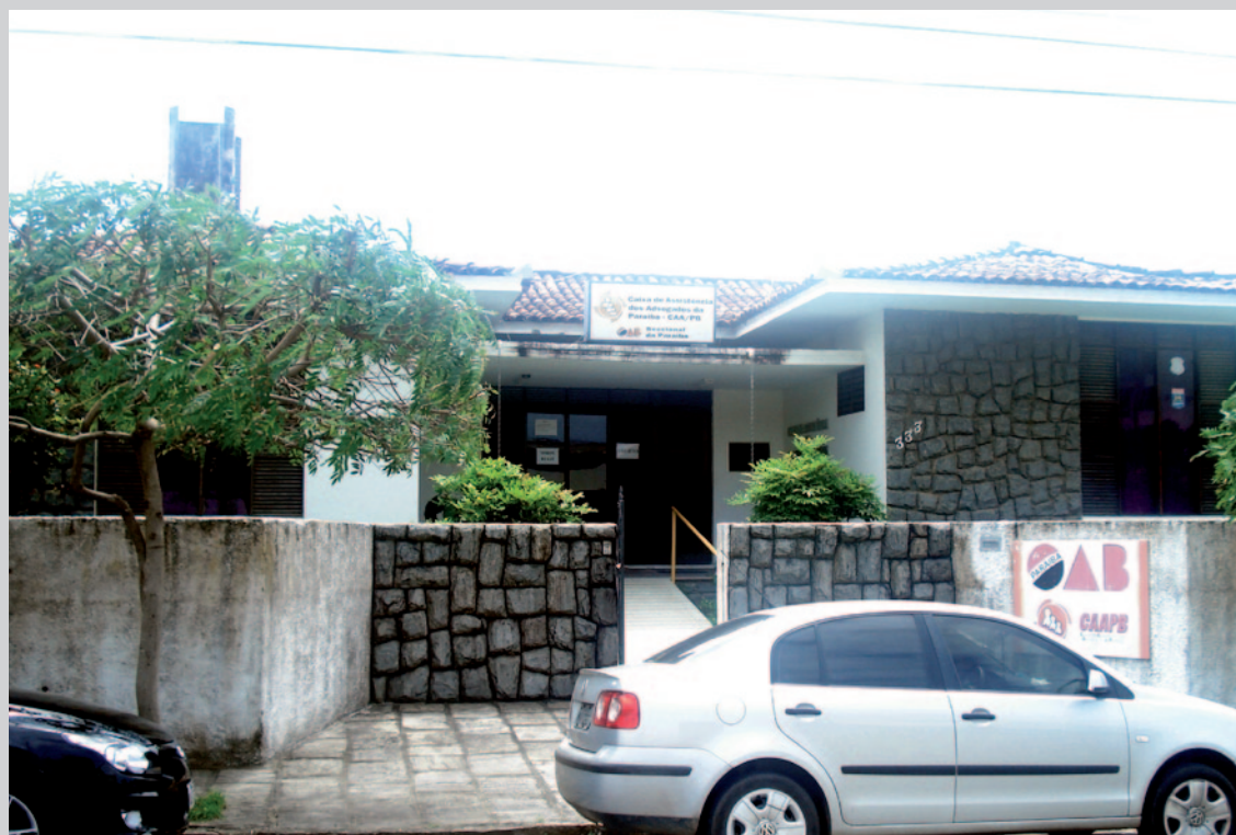
Sede da CAA/PB