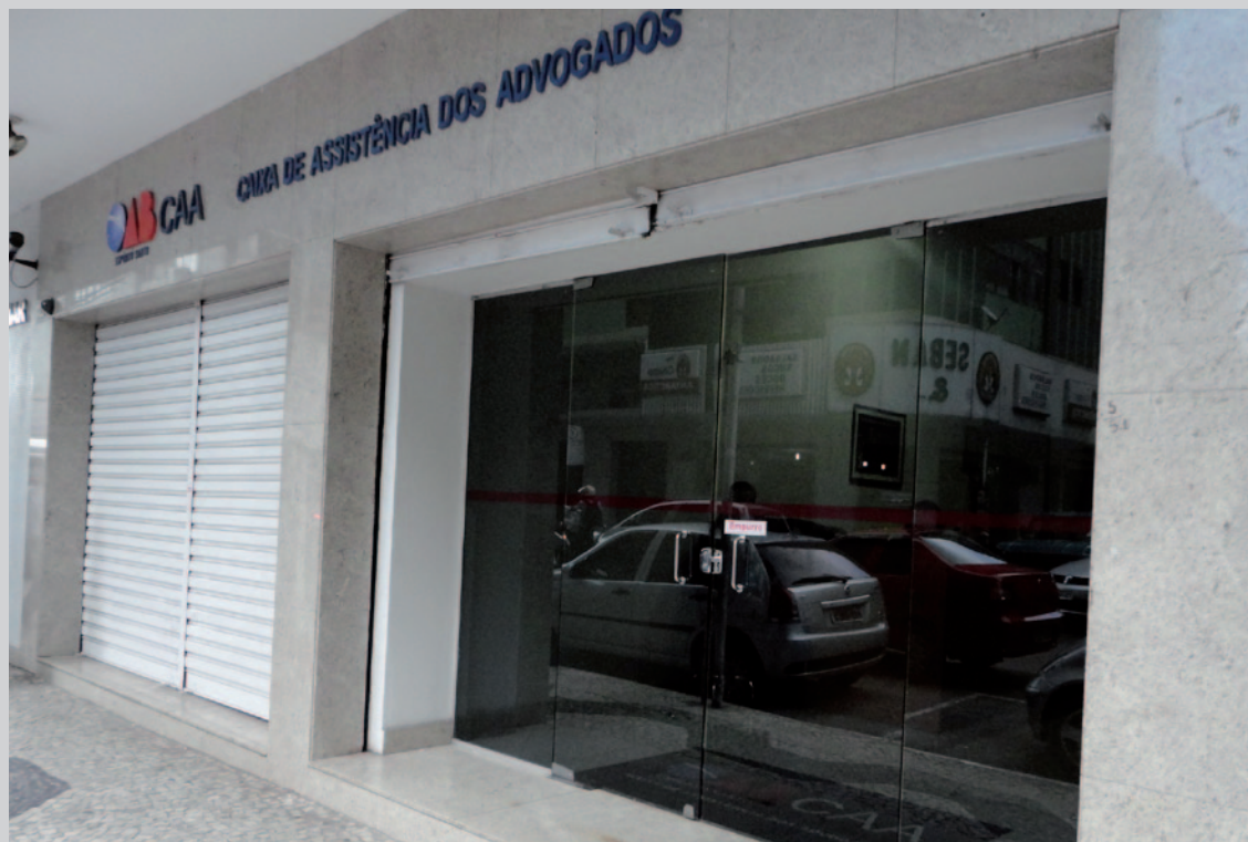
Sede da CAA/ES