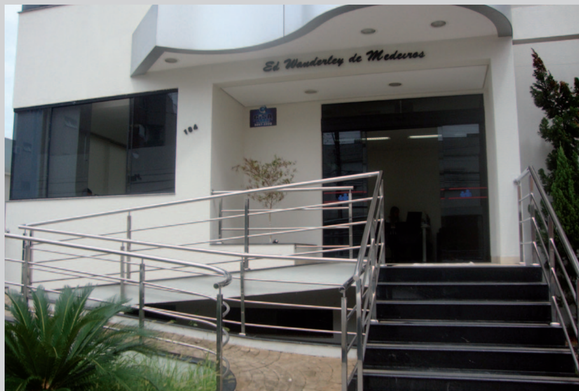
Sede da CASAG