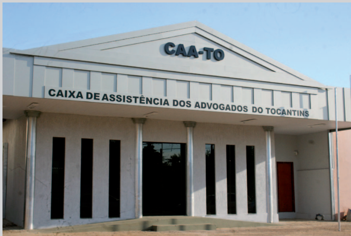
Sede da CAA/TO