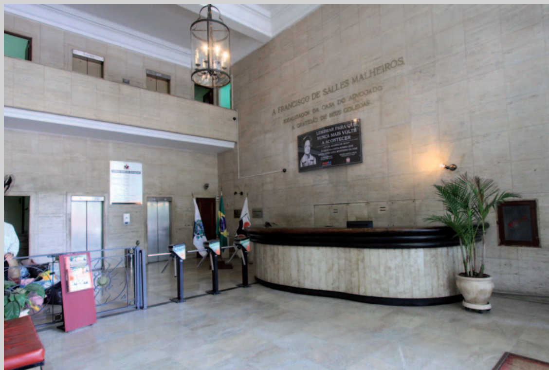
Sede da CAA/RJ