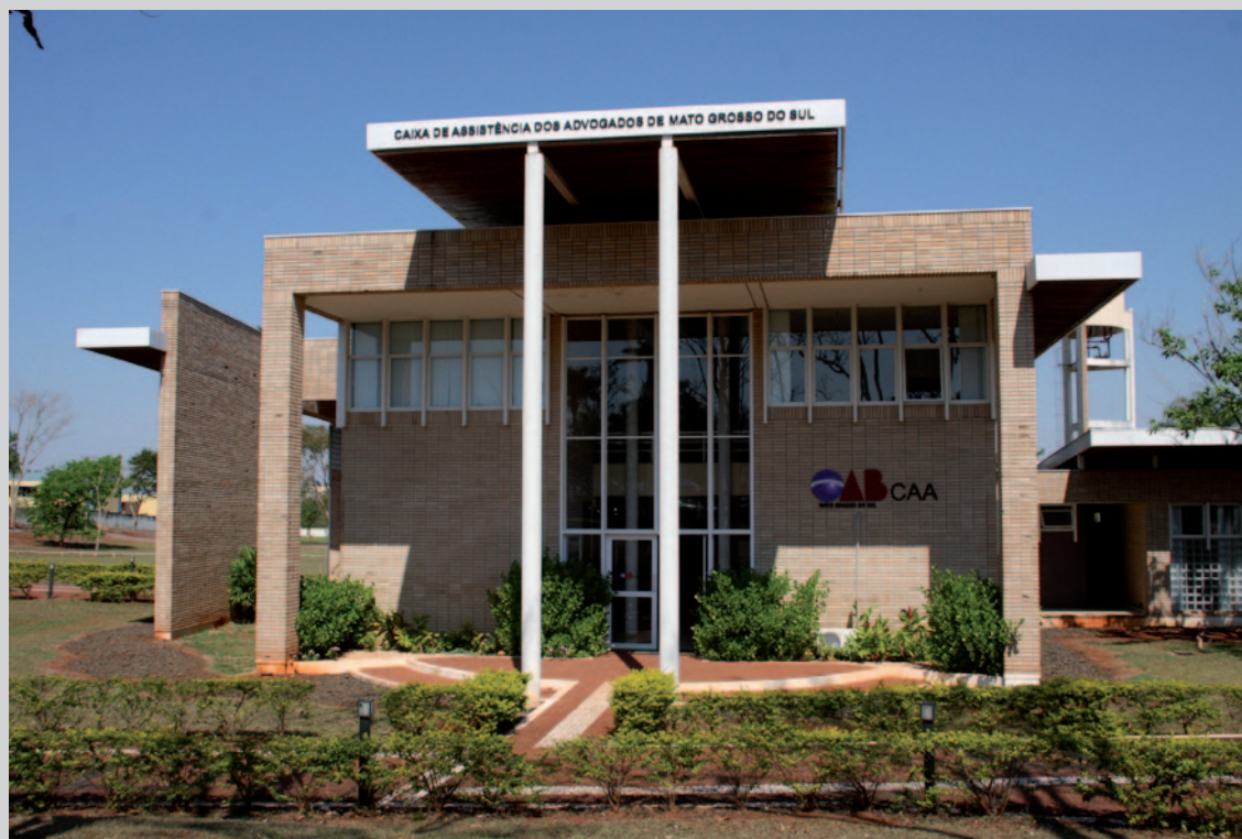
Sede da CAA/MS