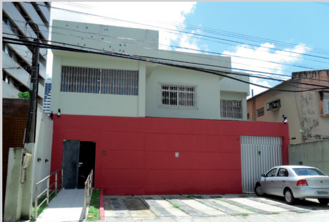
Sede da CAA/PE