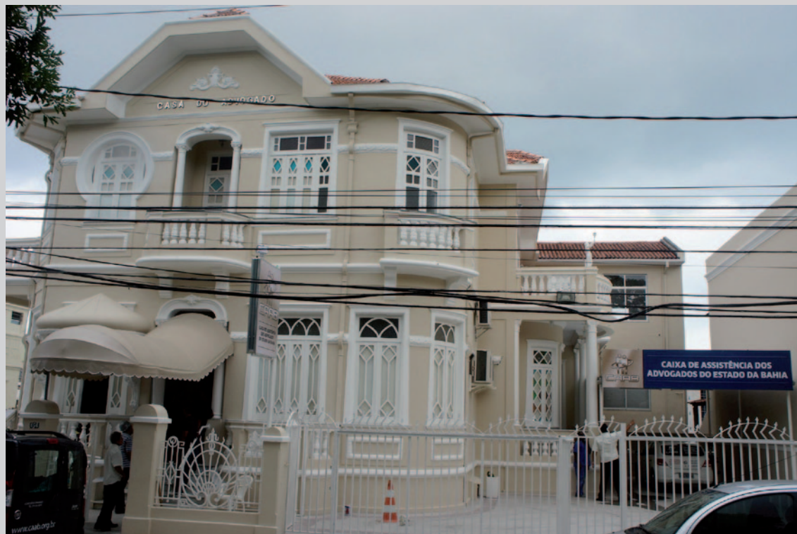
Sede da CAA/BA