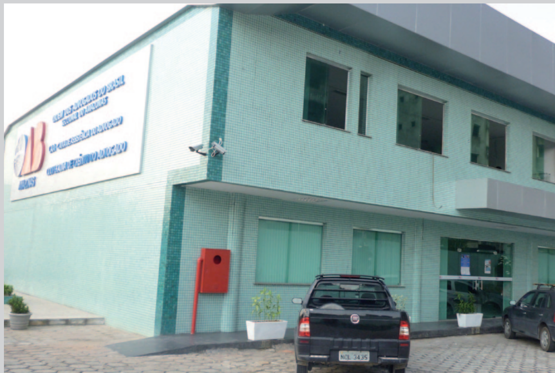
Sede da CAA/AM