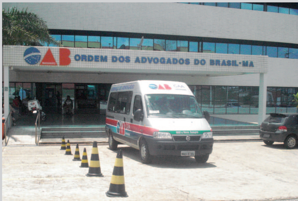
Sede da CAA/MA