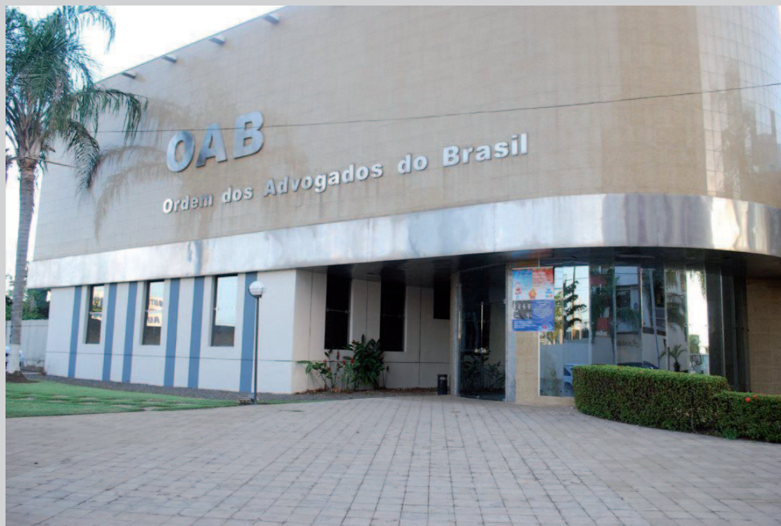
Sede da CAA/RO