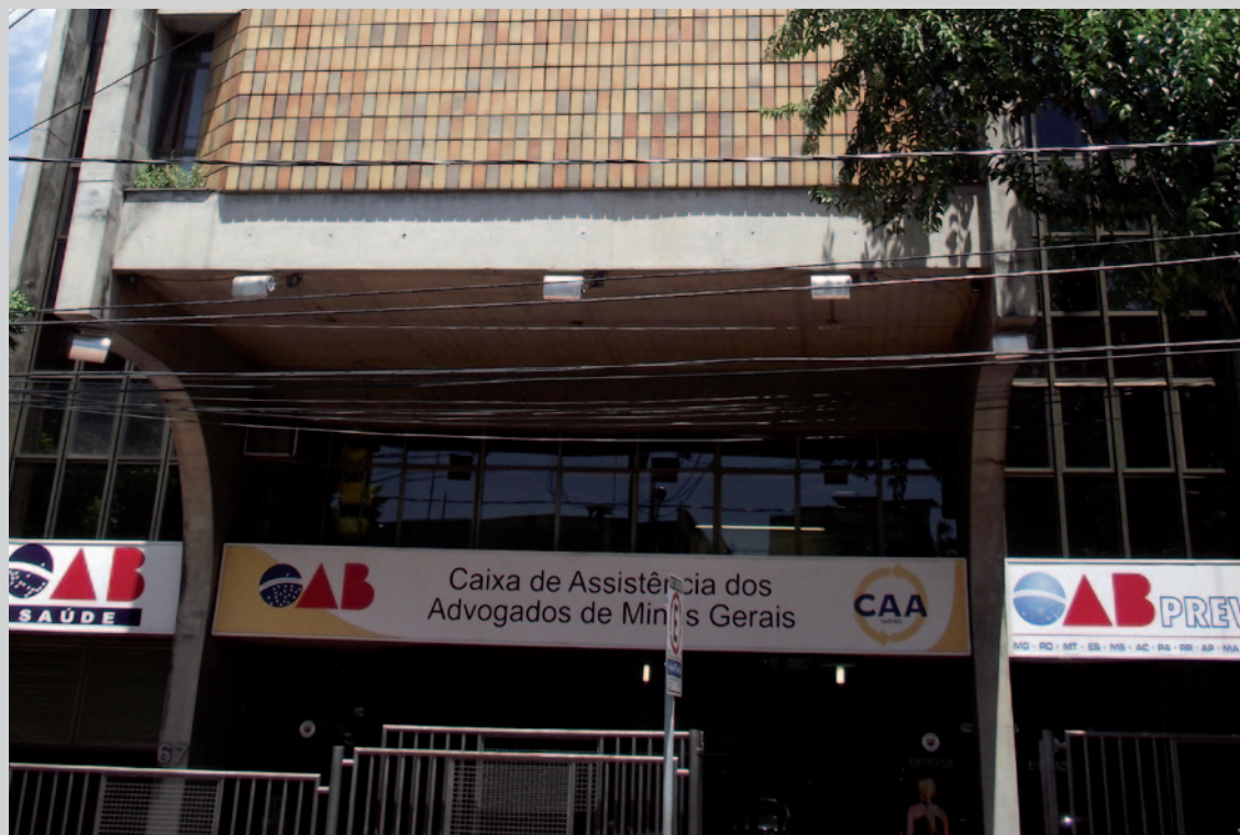
Sede da CAA/MG