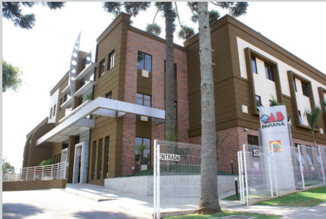
Sede da CAA/PR