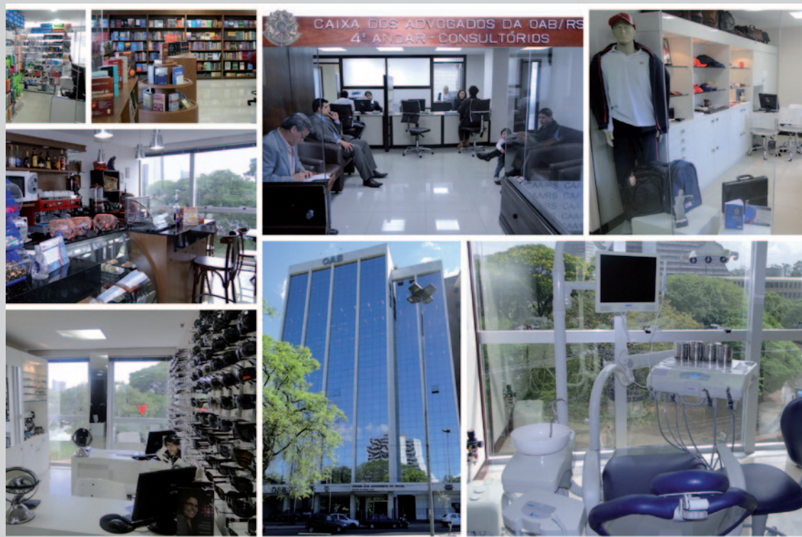
Sede e instalações da CAA/RS