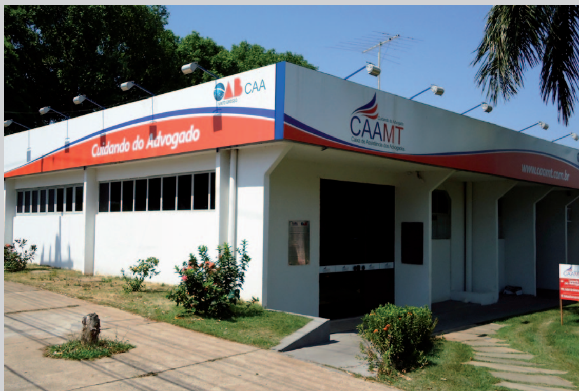
Sede da CAA/MT