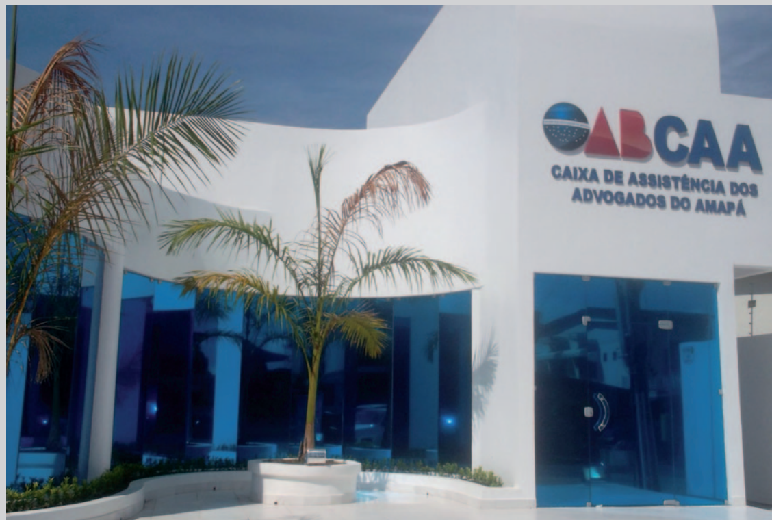
Sede da CAA/AP