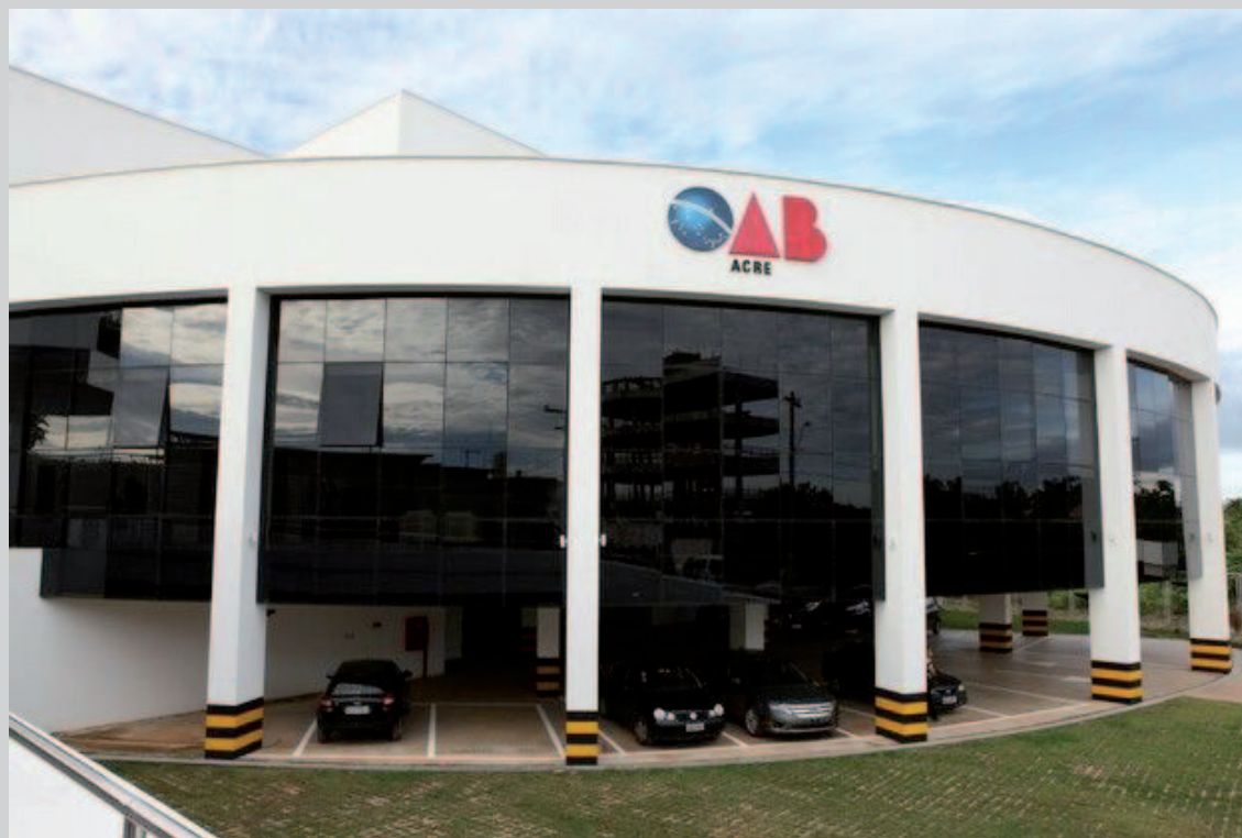
Sede da CAA/AC