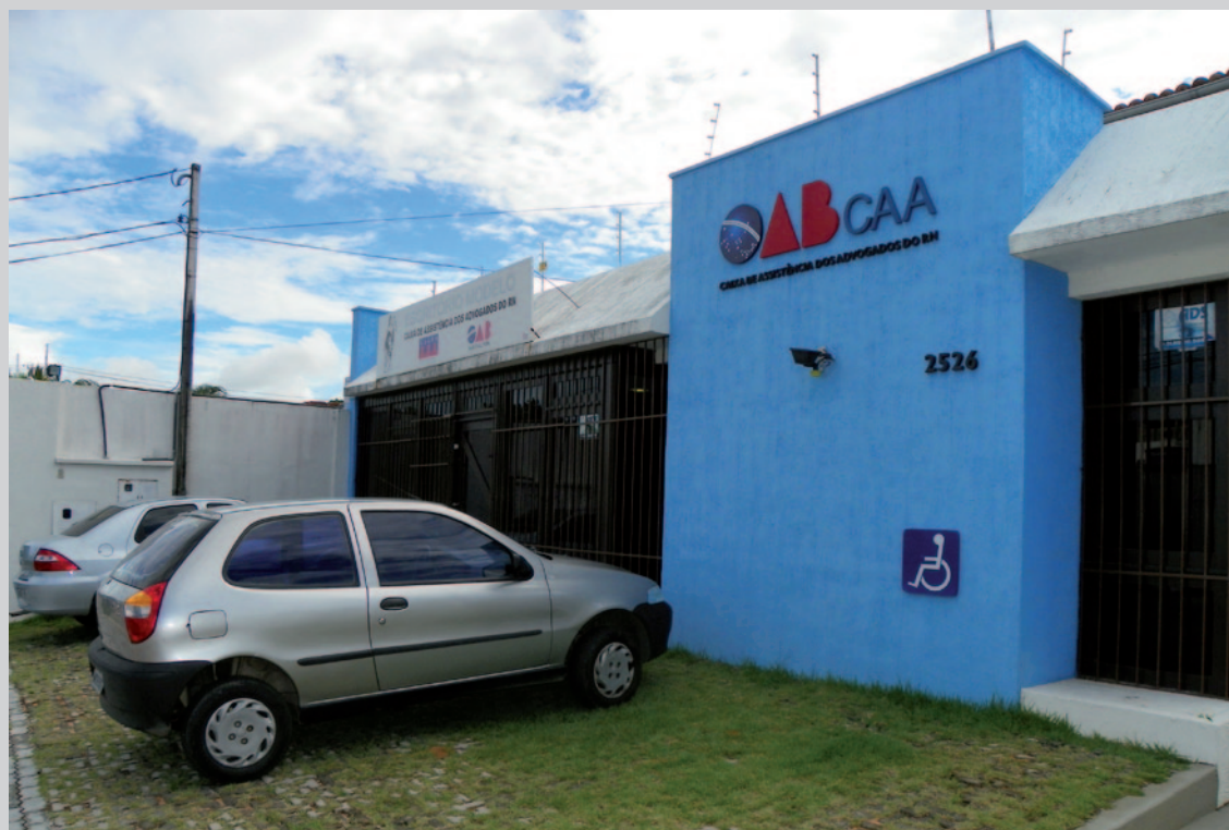
Sede da CAA/RN