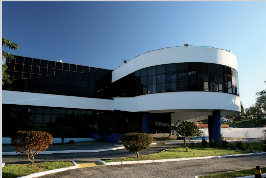
Sede da CAA/SC